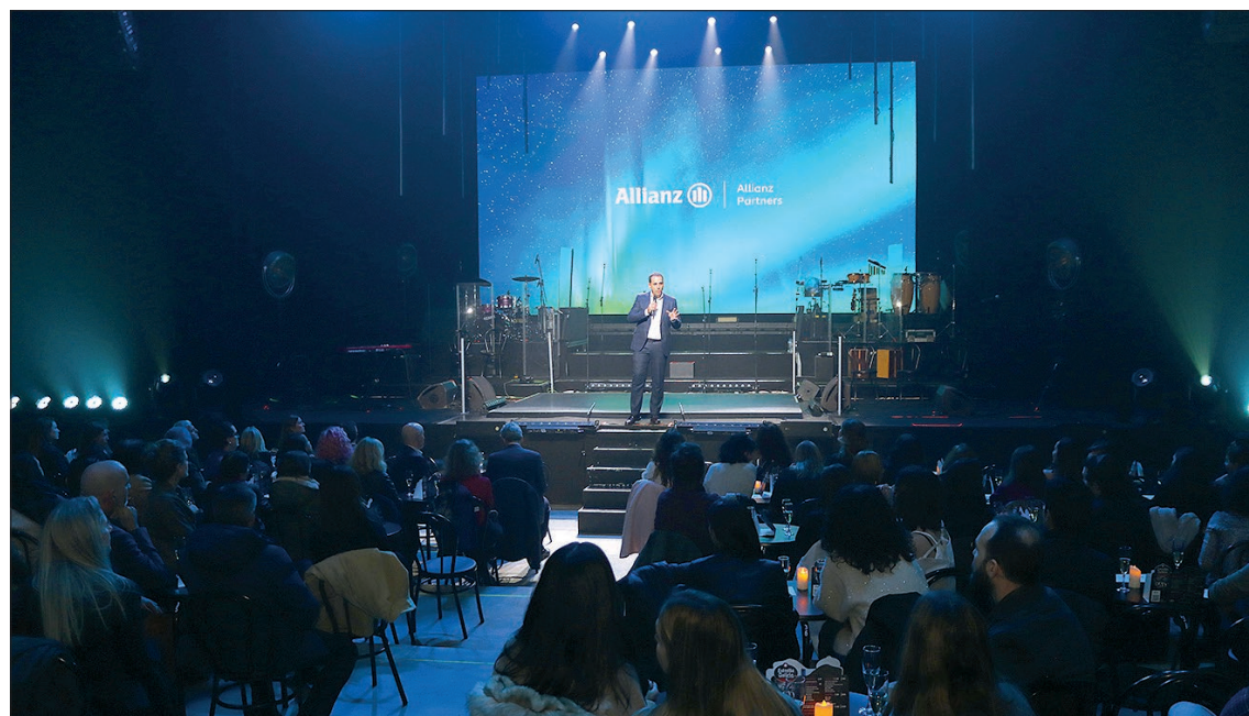
Evento Allianz Partners.

Esta visión no se limita a la eficiencia operativa. Allianz Partners ha hecho del compromiso con sus empleados una seña de identidad. Desde 2007, la empresa fue pionera en implantar el teletrabajo y ha desarrollado políticas avan-