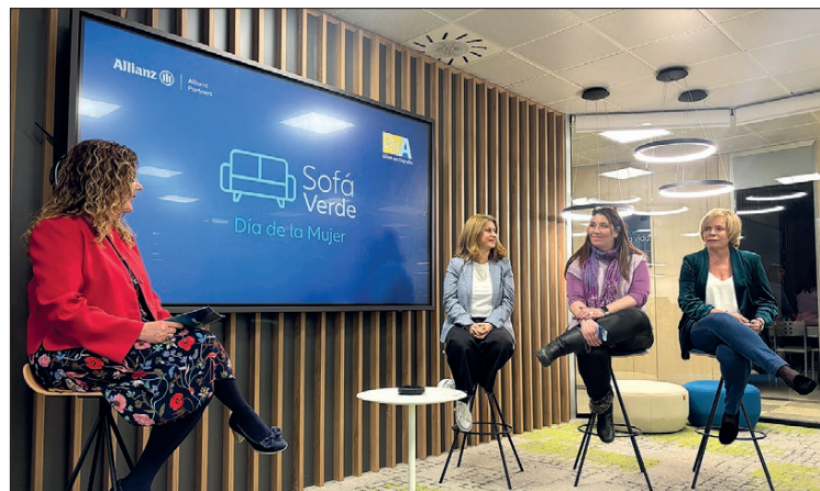
Evento interno con empleados con motivo del Día de la Mujer.