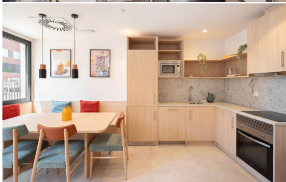
Residencia Nodis Madrid Vicálvaro