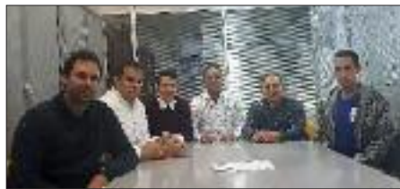
Equipo de Spica

Nacimos en 2009 con el objetivo de dar continuidad a los clientes del área de informática de la extinguida GTD Sistemas Industriales. El bagaje anterior, de más de 20 años, nos permitió acceder a grandes clientes a los que de otra manera hubiera sido francamente difícil llegar para una empresa pequeña. Sobre esa base,